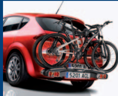
nosič jízdních kol na hlavu tažného zařízení