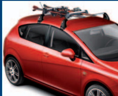
střešní nosič – nosič lyží a snowboardů