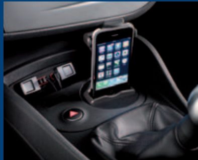
držák pro iPod®/iPhone®