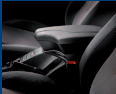
středová loketní opěrka